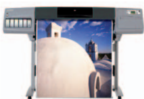
imprimante hp designjet 5500 (série 42 pouces)

Découvrez les solutions d'impression intelligentes assurant la simplification des tâches et la réduction des interventions de l'utilisateur.